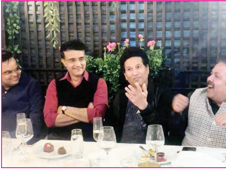
युवराज सिंह ने भी किया सम्मान पूर्व भारतीय ऑलराउंडर युवराज सिंह, जिन्होंने गांगुली की कप्तानी में अपने अंतरराष्ट्रीय करियर को शुरूआत की और सफलता हासिल की, उन्होंने भी अपने पूर्व

सचिन ने खास अंदाज में दी बधाई सचिन तेंदुलकर ने सोशल मीडिया प्लेटफॉर्म एक्स पर लिखा, '14 साल की उम्र से हम एक-दूसरे को जानते हैं, इसलिए अब बहुत कम चीजें चौंकाती हैं। यह भी उनमें से एक नहीं थी। बधाई हो सौरव। आपको आईसीसी हॉल ऑफ फेम में देखकर बेहद खुशी हुई।' सचिन के इस संदेश का जवाब देते हुए गांगुली ने लिखा, 'धन्यवाद सचिन। आपके साथ उसी सूची में शामिल होना मेरे लिए सबसे बड़ा संतोष बने है।'