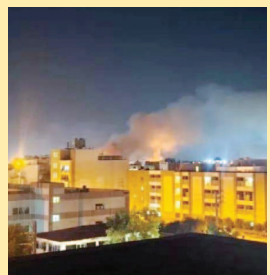
अमेरिका ने लगातार दूसरी रात की बमबारी, तेहरान-भ्रमहद रेलवे लाइन क्षतिग्रस्त

तेहरान, 09 जुलाई। बुधवार से शुरू हुए अमेरिका के हमलों में पांच प्रांतों में 14 लोगों की मौत हो गई है और 78 लोग घायल हुए हैं। होर्मुज जलडमरूमध्य के पास बसे ईरान के तटीय शहरों बुशहर, चाबहार, बंदर अब्बास और सिरिक में गुरुवार को जोरदार धमाके हुए हैं। अमेरिका ने लगातार दूसरी रात ईरानी शहरों पर बमबारी की। अल जजिरा की रिपोर्ट के अनुसार ईरान के स्वास्थ्य मंत्रालय ने कहा कि उसने जवाबी हमलों में बहरीन, कुवैत और कतर में अमेरिकी ठिकानों और रणनीतिक केंद्रों पर हमला किया है। अमेरिकी राष्ट्रपति डोनाल्ड ट्रंप का कहना है कि यह हमले होर्मुज जलडमरूमध्य से गुजरने वाले जहाजों पर ईरान के कथित हमलों के बदले में किए गए। कतर के प्रधानमंत्री शेख मोहम्मद बिन अब्दुल रहमान बिन जसीम अल थानी ने ईरानी विदेश मंत्री अब्बास अरागवी के साथ फोन पर बातचीत में होर्मुज जलडमरूमध्य में कमर्शियल जहाजों को निशाना