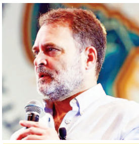
ऑनलाइन अभियान से जुड़कर छात्र साझा करेंगे सुझाव, सरकार तक पहुंचेगी आवाज

नई दिल्ली, 18 जून। लोकसभा में विपक्ष के नेता और कांग्रेस सांसद राहुल गांधी ने छात्रों और युवाओं से जुड़े मुद्दों को लेकर गुरुवार को 'छात्रों की गूंज' नाम से नया अभियान शुरू किया। सोशल मीडिया प्लेटफॉर्म 'एक्स' पर इसकी जानकारी देते हुए उन्होंने देशभर के छात्रों से इस पहल का हिस्सा बनने और शिक्षा व रोजगार से जुड़े अपने सुझाव साझा करने की अपील की। राहुल गांधी ने कहा कि यह अभियान उन लाखों छात्रों की आवाज बनने का प्रयास है, जिन्होंने पेपर लीक, परीक्षाओं में धांधली, बढ़ती फीस और रोजगार जैसी समस्याओं का सामना किया है। उन्होंने कहा कि कई परिवार अपने बच्चों की पढ़ाई के लिए जीवनभर की जमा-पूजी खर्च कर देते हैं, लेकिन व्यवस्था की खामियों के कारण छात्रों के सपने अधूरे रह जाते हैं। उन्होंने बताया कि 'छात्रों की गूंज' केवल एक अभियान नहीं, बल्कि छात्रों की मांगों को सरकार तक पहुंचाने का माध्यम है। इसके