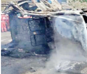
सैन्य विराम के बावजूद हमले तेज, कई देशों ने इजराइल की कड़ी निंदा की