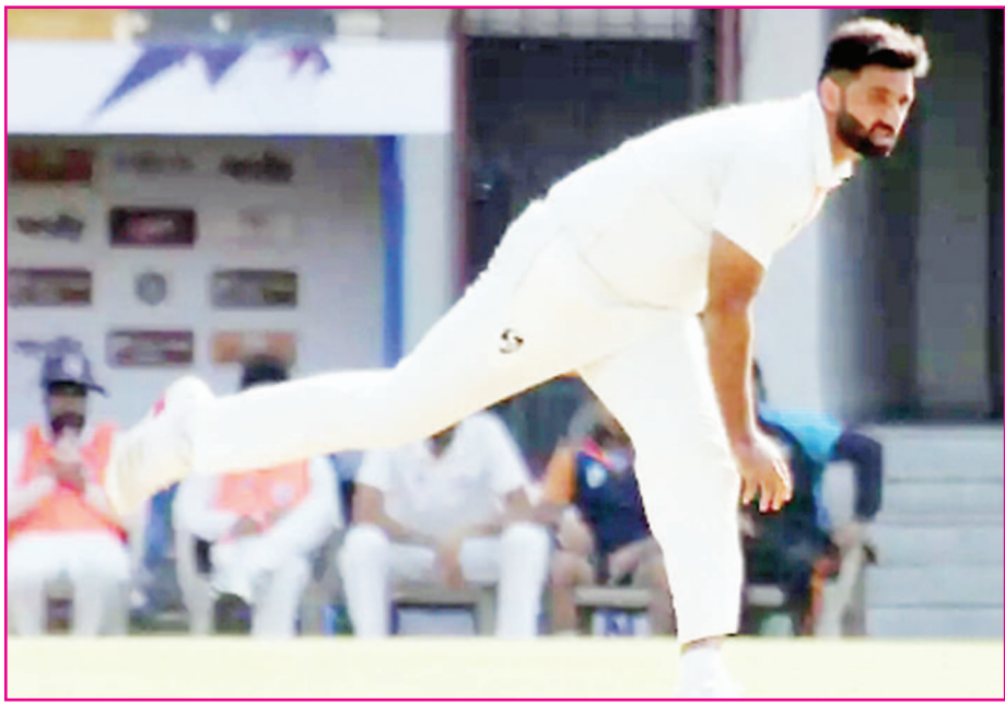
और वह अफगानिस्तान टेस्ट के बाद होने वाली वनडे श्रृंखला के लिए भी भारतीय टीम का हिस्सा