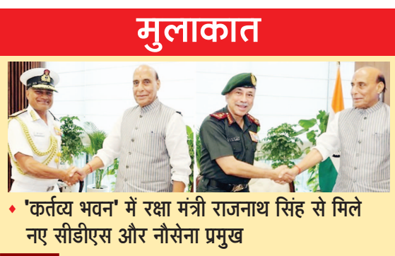
सुब्रमण्यम ने कहा कि सशस्त्र बलों में बदलाव के लिए संगठनात्मक सुधार पर मुख्य फोकस होगा। इसी तरह नए नौसेना प्रमुख एडमिरल कृष्णा स्वामीनाथन ने कहा, 'मैं अपनी

नई दिल्ली, 02 जून। चीफ ऑफ डिफेंस स्टाफ (सीडीएस) और नौसेना प्रमुख बदलने के बाद इस साल के अंत तक भारतीय सशस्त्र बलों का शीर्ष नेतृत्व पूरी तरह बदल जाएगा। रक्षा मंत्री राजनाथ सिंह से मंगलवार को 'कर्तव्य भवन' में देश के नए चीफ ऑफ डिफेंस स्टाफ (सीडीएस) जनरल एनएस राजा सुब्रमण्यम और नौसेना प्रमुख एडमिरल कृष्णा स्वामीनाथन ने मुलाकात की। दोनों ही अधिकारियों ने 31 मई को अपने-अपने पद संभाले हैं। देश के तीसरे चीफ ऑफ डिफेंस स्टाफ (सीडीएस) के तौर पर कार्यभार संभालने वाले जनरल एनएस राजा