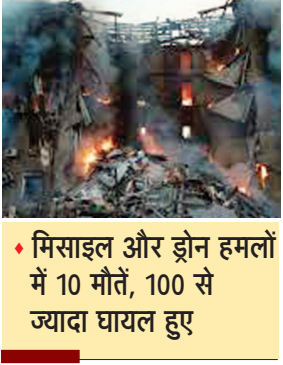
मिसाइल और ड्रोन हमलों में 10 मौतें, 100 से ज्यादा घायल हुए

कीव, 02 जून। रूस ने सोमवार रात से मंगलवार सुबह तक यूक्रेन पर बड़े पैमाने पर मिसाइल और ड्रोन हमले किए, जिससे राजधानी कीव समेत कई शहरों में भारी तबाही मच गई। अधिकारियों के अनुसार इन हमलों में कम से कम 10 लोगों की मौत हो गई, जबकि 100 से अधिक लोग घायल हुए हैं। मृतकों में चार लोग राजधानी कीव और छह लोग मध्य यूक्रेन के प्रमुख शहर नीप्रो के बताए जा रहे हैं। कई घायलों की हालत गंभीर होने के कारण मृतकों की संख्या बढ़ने की आशंका जताई जा रही है।