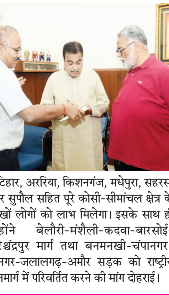
कटिहार, अररिया, किशनगंज, मधेपुरा, सहरसा और सुपौल सहित पूरे कोसी-सीमांचल क्षेत्र के लाखों लोगों को लाभ मिलेगा। इसके साथ ही उन्होंने बेल्तौरी-मंशौली-कदवा-बारसोई-हरिश्चंद्रपुर मार्ग तथा बनमनखी-चंपानगर-श्रीनगर-जलालगढ़-अमौर सड़क को राष्ट्रीय राजमार्ग में परिवर्तित करने की मांग देहराई।

पूर्णिया, 02 जून। पूर्णिया के सांसद पप्पू यादव ने दिल्ली में केन्द्रीय सड़क परिवहन एवं राजमार्ग मंत्री नितिन गडकरी से मुलाकात कर कोसी-सीमांचल क्षेत्र की लंबित सड़क एवं आधारभूत संरचना परियोजनाओं को लेकर विस्तृत ज्ञापन सौंपा। सांसद ने एनएच-31 के जीरो माइल (गुलाबबाग) से पूर्णिया एयरपोर्ट तक सीधे राष्ट्रीय राजमार्ग अथवा फोरलेन संपर्क मार्ग के निर्माण की मांग करते हुए कहा कि यह परियोजना पूरे सीमांचल क्षेत्र के विकास के लिए अत्यंत महत्वपूर्ण है। उन्होंने कहा कि वर्तमान में एयरपोर्ट तक बेहतर सड़क संपर्क नहीं होने के कारण यात्रियों, व्यापारियों और आम लोगों को परेशानी का सामना करना पड़ता है तथा शहर में लगातार बढ़ते ट्रैफिक दबाव से जाम की समस्या गंभीर होती जा रही है। सांसद ने कहा कि प्रस्तावित फोरलेन सड़क बनने से पूर्णिया,