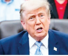
चार रिपब्लिकन भी समर्थन में, अब सीनेट में होगी परीक्षा

वाशिंगटन, 04 जून। अमेरिकी कांग्रेस के निचले सदन प्रतिनिधि सभा (हाउस ऑफ रिप्रेजेंटेटिव्स) ने राष्ट्रपति डोनाल्ड ट्रंप के ईरान के खिलाफ सैन्य कार्रवाई संबंधी अधिकारों को सीमित करने वाला महत्वपूर्ण 'वॉर पावर्स रेजोल्यूशन' पारित कर दिया है। 215-208 मतों से पारित इस प्रस्ताव को ट्रंप प्रशासन के लिए बड़ा राजनीतिक झटका माना जा रहा है।