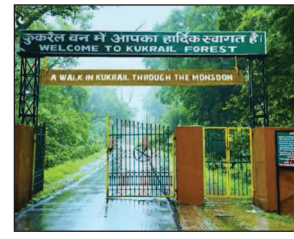
लखनऊ, 04 जून (तरुणमित्र)। प्रधानमंत्री नरेंद्र मोदी के आह्वान पर विश्व पर्यावरण दिवस पर शुक्रवार को एक पेड़ मां के नाम अभियान के तहत व्यापक स्तर पर पौधरोपण किया जाएगा। उत्तर प्रदेश में मुख्यमंत्री योगी आदित्यनाथ कुकरैल वन क्षेत्र से इसका शुभारंभ करेंगे।

इसके पश्चात प्रदेश के 17 नगर निगमों, 825 विकास खंडों, 762 नगर निकायों समेत सभी ग्राम पंचायतों में यह अभियान पूरे दिन चलेगा। वन विभाग के संयोजकत्व में ग्राम्य विकास, पंचायती राज, कृषि, उद्यान, नगर विकास आदि विभागों के सहयोग से अमृत सरोवर, तालाबों, सड़कों, एक्सप्रेसवे, नदियों, नहरों आदि के किनारे पौधे लगाए जाएंगे। इसमें विद्यालयों, महाविद्यालयों, संगठनों आदि की भी सहभागिता होगी। राज्य सरकार के प्रवक्ता ने बताया कि ग्राम्य विकास विभाग तीन करोड़ पौधे लगाएगा, कृषि विभाग 75 लाख, वन विभाग 50 लाख, उद्यान विभाग 50 लाख, पंचायती राज विभाग 20 लाख, नगर विकास पांच लाख पौधे रोपेगा।