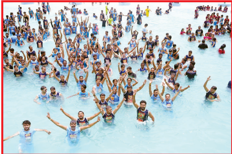
जन भवन में कार्यरत समस्त आउटसोर्सिंग मानव शक्तियों तथा दैनिक श्रमिकों के लिए आयोजित निःशुल्क दो दिवसीय वाटर पार्क में मस्ती करके कर्मचारी।