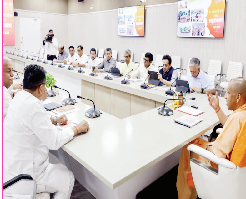
लखनऊ में अपने सरकारी आवास पर पर्यटन विभाग के कार्यों की समीक्षा करते सीएम योगी आदित्यनाथ।

लखनऊ, 04 जून। मुख्यमंत्री योगी आदित्यनाथ ने कहा है कि उत्तर प्रदेश केवल आस्था का केंद्र नहीं, बल्कि भारत की सांस्कृतिक चेतना, आध्यात्मिक परंपरा और ज्ञान विरासत का प्रतिनिधि प्रदेश है। उन्होंने कहा कि पर्यटन विकास को केवल आधारभूत संरचना तक सीमित न रखकर सांस्कृतिक पुनर्जागरण, स्थानीय अर्थव्यवस्था, रोजगार सृजन और वैश्विक पहचान से जोड़ते हुए आगे बढ़ाया जाना चाहिए। गुरुवार को पर्यटन विभाग की समीक्षा बैठक में मुख्यमंत्री ने कहा कि प्रदेश की सांस्कृतिक अर्थव्यवस्था को नई गति देने में पर्यटन की महत्वपूर्ण भूमिका है। पर्यटन के माध्यम से स्थानीय उत्पादों, हस्तशिल्प, पारंपरिक कला, खानपान, संस्कृति और सेवा क्षेत्र को व्यापक अवसर प्राप्त होगा। उन्होंने पर्यटन नीति-2022 में प्रस्तावित संशोधनों की समीक्षा करते हुए उत्तर प्रदेश को निवेश, नवाचार और अनुभव आधारित पर्यटन का अग्रणी केंद्र बनाने पर जोर दिया। शेष पेज 15 पर