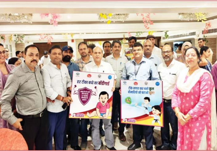
डोज' कार्यक्रम ऐसे बच्चों तक पहुंचने का प्रयास है जो किसी कारणवश टीकाकरण से छूट गए हैं। उन्होंने कहा कि स्वास्थ्य विभाग, एड्डा इंडिया एवं अन्य

बरेली, 04 जून (तरुणमित्र)। स्वास्थ्य विभाग के तत्वावधान तथा एड्डा इंडिया के सहयोग से संचालित 'जीरो डोज' कार्यक्रम के द्वितीय चरण के अंतर्गत बृहस्पतिवार को स्थानीय होटल में एक दिवसीय अभिमुखीकरण एवं संवैदीकरण कार्यशाला आयोजित की गई। कार्यशाला का उद्देश्य जनपद के शहरी एवं ग्रामीण क्षेत्रों में नियमित टीकाकरण से वंचित (जीरो डोज) बच्चों की पहचान कर उन्हें पूर्ण प्रतिरक्षण चक्र में शामिल करते हुए शत-प्रतिशत टीकाकरण सुनिश्चित करना है।