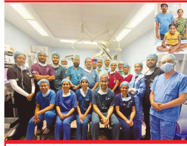
रोबोटिक सर्जरी में केजीएमयू ने रचा इतिहास।