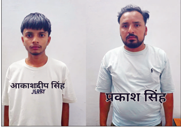
करते थे। एसटीएफ ने बुधवार रात इटौंजा टोल प्लाजा के पास कार्रवाई

नेपाल से लाते थे ब्राउन शुगर मुंबई-पुणे में करते थे सप्लाई