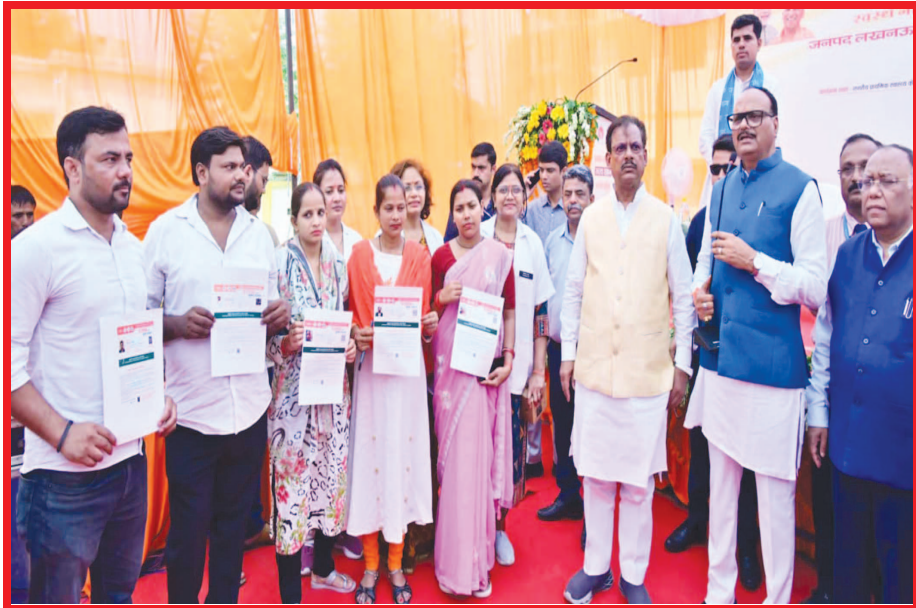
लखनऊ में स्थापित 14 सिटी पॉलीक्लिनिक के लोकार्पण कार्यक्रम में पात्र लाभार्थियों को आयुष्मान भारत कार्ड एवं पोषण पोटली का वितरण करते उपमुख्यमंत्री ब्रजेश पाठक।

लखनऊ, 12 जून (तरुणमित्र)। कौशल विकास मिशन और नेशनल स्टॉक एक्सचेंज के बीच शुक्रवार को एमओयू हुआ। जिसके तहत डेढ़ लाख युवाओं को फाइनेंशियल स्किल्स की ट्रेनिंग दी जायेगी। यह प्रशिक्षण प्रदेश के 1000 ट्रेनिंग सेंटर में युवाओं को अगले हफ्ते से फाइनेंशियल स्किलिंग की विशेष ट्रेनिंग दी जाएगी। कौशल विकास एवं उद्यमशीलता राज्यमंत्री कपिल देव अग्रवाल ने कहा कि कौशल प्रशिक्षण के बाद रोजगार पाने वाले युवा अब केवल आय अर्जित नहीं करेंगे, बल्कि यह भी समझेंगे कि पहली सैलरी का सही उपयोग कैसे करें। बजट और बचत कैसे शुरू करें, इन्वेस्टमेंट कब और कहाँ करना चाहिए, लोन से कैसे बचना है, भविष्य की आर्थिक सुरक्षा कैसे तैयार करनी है। यह ट्रेनिंग युवाओं को घर खरीदने, व्यवसाय शुरू करने, परिवार की आर्थिक सुरक्षा, बच्चों की शिक्षा, स्वास्थ्य और सेवानिवृत्ति जैसे जीवन के बड़े निर्णय लेने में भी सक्षम बनाएगी। उन्हें ऑनलाइन धोखाधड़ी, फर्जी निवेश योजनाओं और आर्थिक जोखिमों से सुरक्षित रहने में भी मदद करेगी।