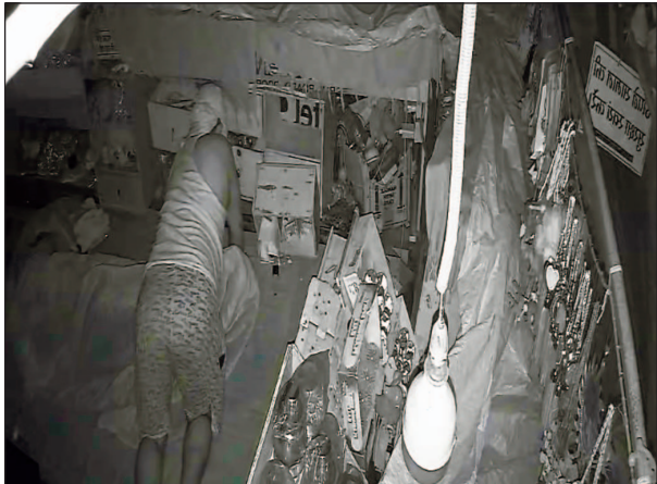
क्षेत्र के कठवारा चौकी अंतर्गत आने वाले चंद्रिका देवी मंदिर

बख्शी का तालाब, लखनऊ, 08 जून (तरुणमित्र)। थाना क्षेत्र में क्षेत्र में इन दिनों चोरों के हाँसेले बुलंद हैं। कानून व्यवस्था को ठेंगा दिखाते हुए चोरों ने अब क्षेत्र के सुप्रसिद्ध और प्रतिष्ठित मां चंद्रिका देवी मंदिर परिसर को अपना निशाना बनाना शुरू कर दिया है।