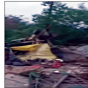
लखनऊ, 08 जून (तरुणमित्र)। चिनहट थाना क्षेत्र में तेज रफार डंपर बेकाबू होकर सड़क किनारे सब्जी की दुकानों पर चढ़ते हुए पलट गया। हादसे में दुकान के अंदर सो रहे दो युवक गंभीर रूप से घायल हो गए। एक युवक की हालत नाजुक है। हादसे

चंद्रिका देवी मंदिर एक बेहद प्रतिष्ठित धार्मिक स्थल है, जहाँ श्रद्धालुओं की भारी भीड़ रहती है। ऐसे संवेदनशील स्थान पर लगातार चोरियाँ होना पुलिस गश्त की पोल खोलता है। स्थानीय निवासियों का आरोप है कि पिछले दिनों क्षेत्र में कई ई-रिक्षा व बैटरी चोरी, फार्म हाउस चोरी और आंगनबाड़ी केंद्र में चोरी की घटनाएँ हो चुकी हैं। इन सभी मामलों में कठवारा पुलिस चोरों को पकड़ने में पूरी तरह नाकाम साबित हुई है। व्यापारियों ने चेतावनी दी है कि, यदि जल्द ही चोरों की गिरफ्तारी नहीं हुई, तो वे आंदोलन के लिए बाध्य होंगे।