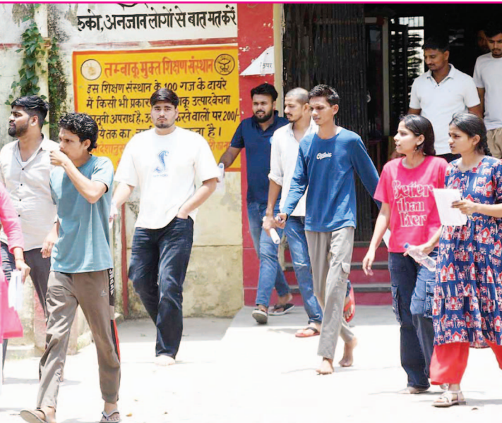
लखनऊ के गोमतीनगर विनय खंड स्थित राजकीय बालिका इंटर कॉलेज से उप पुलिस भर्ती एवं प्रोन्नति बोर्ड द्वारा आयोजित यूपी पुलिस कांस्टेबल भर्ती परीक्षा देकर बाहर निकलते अभ्यर्थी।

कार्रवाई की गई थी। सुनवाई के दौरान अदालत ने पाया कि विवाद मूल रूप से दैवानी प्रकृति का था और उसे संगठित अपराध का स्वरूप नहीं मिलने पर न्यायालय ने पूरी कार्यवाही को निरस्त कर दिया। हालांकि फैसले की सबसे बड़ी चर्चा कानूनी निष्पक्षों से ज्यादा उन टिप्पणियों को लेकर हो रही है, जिनमें अदालत ने प्रदेश की प्रशासनिक कार्यप्रणाली पर सवाल उठाए। न्यायालय ने कहा कि लोकतांत्रिक व्यवस्था में सरकारी तंत्र की जवाबदेही किसी राजनीतिक दल या सरकार के प्रति नहीं, बल्कि संविधान और कानून के प्रति होनी चाहिए। यही टिप्पणी अब बहस का केंद्र बन गई है। विशेषज्ञों का मानना है कि अदालत ने जिस मुद्दे को उठाया है, वह नया नहीं है। पुलिस सुधार, राजनीतिक हस्तक्षेप, ■ शोष पेज 15 पर