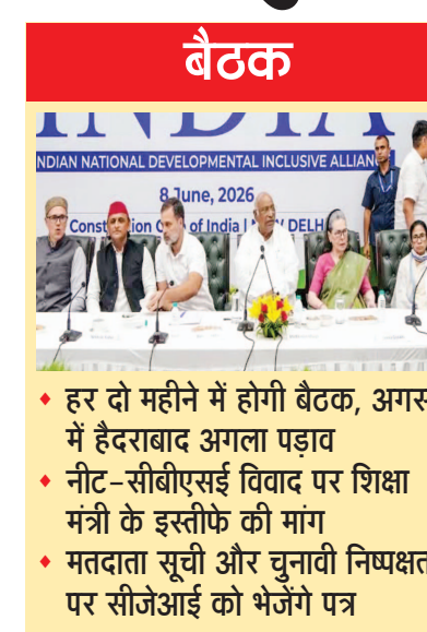
लोकतांत्रिक मूल्यों और संवैधानिक संस्थाओं की

नई दिल्ली 08 जून। आगामी राजनीतिक चुनौतियों तथा संसद से लेकर सड़क तक विपक्ष की साझा रणनीति तैयार करने के उद्देश्य से सोमवार को दिल्ली के कांस्टीट्यूशन क्लब में इंडिया गठबंधन की सातवीं बैठक आयोजित हुई। बैठक में 25 विपक्षी दलों के नेताओं ने हिस्सा लिया। कांग्रेस अध्यक्ष मल्लिकार्जुन खरगे, सोनिया गांधी, राहुल गांधी, तृणमूल कांग्रेस प्रमुख ममता बनर्जी, समाजवादी पार्टी अध्यक्ष अखिलेश यादव, राष्ट्रवादी कांग्रेस पार्टी (एसपी) की सुप्रिया सुले, राजद नेता तेजस्वी यादव, उमर अब्दुल्ला, महबूबा मुफ्ती, कपिल सिब्बल समेत कई वरिष्ठ नेता मौजूद रहे, जबकि शिवसेना (यूबीटी) प्रमुख उद्धव ठाकरे और झारखंड के मुख्यमंत्री हेमंत सोरेन वर्युअल माध्यम से बैठक में शामिल हुए।