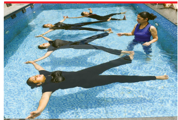
गोमती नगर विनय खंड में स्विमिंग पुल में योग प्रदर्शन करते जगदम्बा योग वेलफेयर सोसाइटी के सदस्य।

मुख्यमंत्री के निर्देश पर परीक्षा में शामिल होने वाले अभ्यर्थियों को राज्य परिवहन निगम की बसों में यात्रा के दौरान किराए में 50 प्रतिशत की छूट प्रदान की जाएगी। मुख्यमंत्री ने कहा कि प्रदेश सरकार युवाओं को पारदर्शी, निष्पक्ष और सुविधाजनक भर्ती प्रक्रिया उपलब्ध कराने के लिए प्रतिबद्ध है। भर्ती परीक्षा में बड़ी संख्या में आवेगमन को देखते हुए यह निर्णय लिया गया है, जिससे उन्हें आर्थिक राहत मिल सके और परीक्षा केंद्र तक पहुंचने में किसी प्रकार की असुविधा न हो।