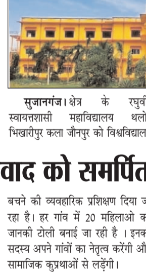
सुजानगंज। क्षेत्र के रघुवीर स्वायत्तशासी महाविद्यालय थलोई भिखरीपुर कला जौनपुर को विश्वविद्यालय