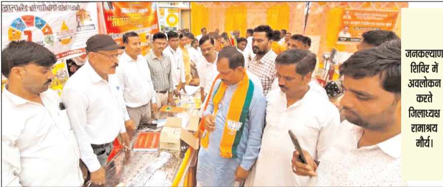
जनकल्याण शिविर में अवलोकन करते जिलास्वस्थ रामाश्रयदा

तरुणमित्र न्यूज मऊ। केंद्र सरकार के 12 वर्ष पूर्ण होने के उपलक्ष्य में जनपद के समस्त विकास खंडों में समेकित जनकल्याण एवं जनजागरूकता अभियान के अंतर्गत जनकल्याण शिविरों एवं स्वास्थ्य मेलों का आयोजन रविवार को किया गया। यह आयोजन 14, 15 एवं 16 जून तक संचालित किया जाएगा, जिसमें विभिन्न विभागों द्वारा आमजन को सरकारी योजनाओं की जानकारी उपलब्ध कराई जा रही है तथा पात्र लाभार्थियों के आवेदन भी प्राप्त किए जा रहे हैं।