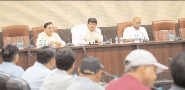
मंत्री कपिल देव अग्रवाल सर्किट हाउस में विभागीय समीक्षा बैठक करते हुए

प्रशिक्षणरत विद्यार्थियों के ड्रॉपआउट प्रतिशत पर सभी प्रधानाचार्यों को विशेष अभियान चलाकर प्रशिक्षार्थियों को काउंसलिंग कराने तथा उनके अभिभावकों से नियमित संपर्क स्थापित करने के निर्देश दिए। उन्होंने कहा कि प्रत्येक संस्थान में ड्रॉपआउट प्रतिशत को शून्य करने के लक्ष्य के साथ कार्य करे पीपीपी मॉडल के