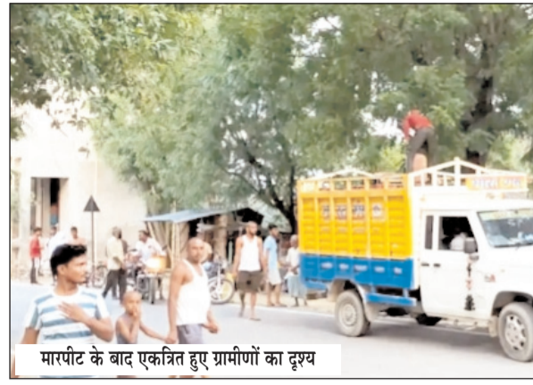
मारपीट के बाद एकजित हुए ग्रामीणों का दृश्य