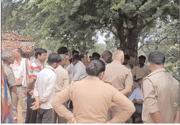
शव मिलने के बाद जांच करती पुलिस

मौरजापुर। लालगंज थाना क्षेत्र के लहंगपुर पुलिस चौकी अंतर्गत गंगहरा खुर्द माईनर के पास बुधवार की सुबह संदिग्ध स्थिति में 21 वर्षीय युवक का शव मिलने की सूचना मिलते ही क्षेत्र में सनसनी फूल गई। युवक के शरीर पर चोट व जलने का निशान से प्रथम दृष्टया बिजली करंट से मौत होना दिखाई दे रहा है। युवक के बहनों के बीच एकलौता भाई था। स्वजनों ने हत्या का आरोप लगाया है। घटनास्थल पर ग्रामीणों की भीड़ जुट गई।