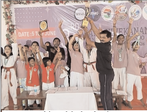
ट्राफी के साथ विजेता खिलाड़ी व कोच