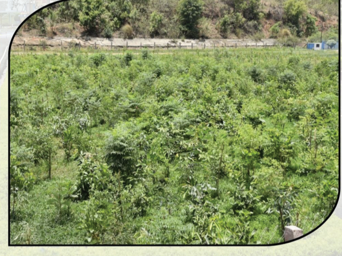
अब तक मियावाकी तकनीक द्वारा 35,000 पौधारोपण

उत्तर प्रदेश का विशालतम विद्युत संयंत्र - 3000 मेगावाट रिहंद नगर, बीजपुर, सोनभद्र, उत्तर प्रदेश - 231223 वेबसाइट www.ntpc.co.in