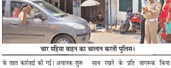
चार पहिया वाहन का चालान करती पुलिस। के तहत कार्रवाई की गई। अचानक शुरू हुए अभियान से वाहन चालकों में अफरा-तफरी का माहौल बना रहा। कई बाइक सवार जांच से बचने के लिए रास्ता बदलते नजर आए, जबकि कई चालक पुलिस की कार्रवाई का सामना करते दिखे। चेकिंग के दौरान पुलिसकर्मियों ने लोगों को यातायात के नियमों के पालन, हेलमेट और सीट बेल्ट के अनिवार्य उपयोग तथा वैध दस्तावेज