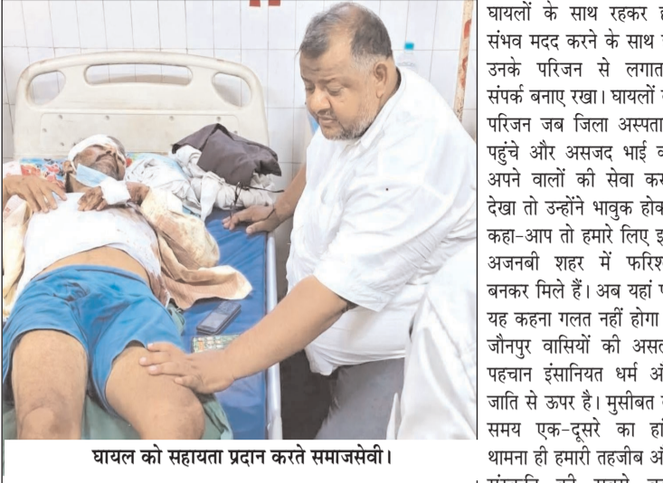
घायल को सहायता प्रदान करते समाजसेवी।