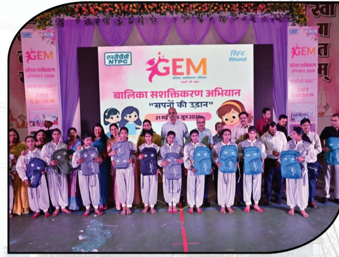
बालिका सशक्तीकरण अभियान के अंतर्गत बालिकाओं का सशक्तीकरण