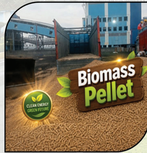
समर्थ मिशन के अंतर्गत वित्तीय वर्ष 2025-26 में 40,848 मीट्रिक टन बायोमास पेलेट का उपयोग