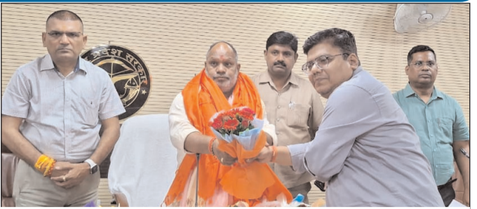
यूपी के मंत्री हंसराज विश्वकर्मा का कार्यक्रम में स्वागत करते उद्योग विभाग के अफसर गण

विभाग की समस्त योजनाओं जैसे मुख्यमंत्री युवा उद्यमी विकास अभियान, मुख्यमंत्री युवा स्वरोजगार योजना, एक जनपद एक उत्पाद वित्त पोषण योजना, विश्वकर्मा श्रम सम्मान योजना, प्रधानमंत्री विश्वकर्मा योजना, एक जनपद एक उत्पाद प्रशिक्षण एवं टूलकिट योजना, एक जनपद एक व्यंजन योजना, एक जनपद एक उत्पाद सीएफसी योजना, एक एस ई - सीडीपी योजना एवं प्लेज पार्क योजना