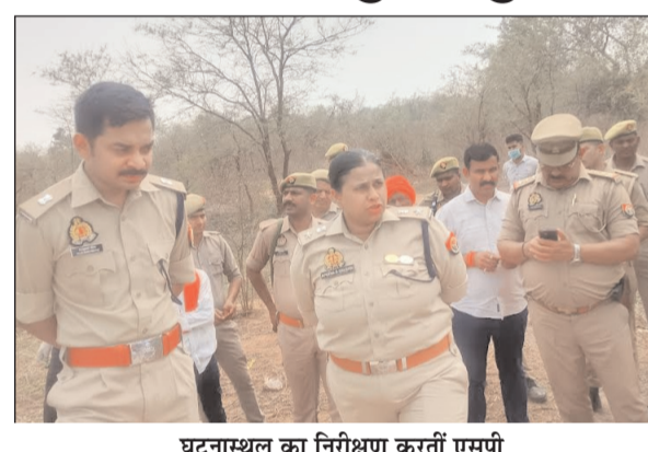
घटनास्थल का निरीक्षण करती एसपी

तरुणमित्र न्यूज मंडिहान, मीरजापुर। मंडिहान थाना क्षेत्र के मिर्जापुर-सोनभद्र मुख्य मार्ग पर स्थित देवरी कला गांव एसपी ने किया मौका-ए-वारदात का निरीक्षण, टीम गाठित