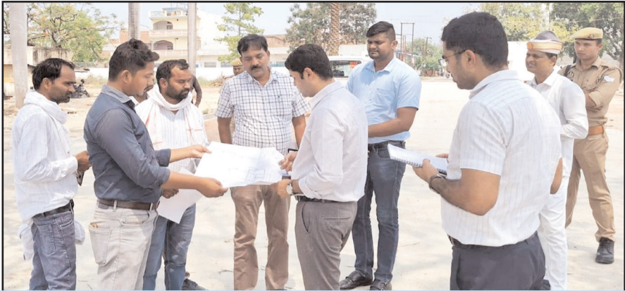
परदहं के औद्योगिक पार्क निर्माण का निरीक्षण करते जिलाधिकारी।

◆ औद्योगिक पार्क के विकसित होने से औद्योगिक गतिविधियों को मिलेगा बढ़ावा ◆ स्थानीय स्तर पर रोजगार के नए अवसर होंगे सृजित: जिलाधिकारी