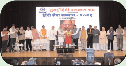
मुंबई हिंदी पत्रकार संघ के कार्यक्रम में बोले मुख्यमंत्री फडणवीस

मुंबई। भाषा विवाद का माध्यम नहीं हो सकता हिंदी इस देश को संपन्न सूर है। भाषाओं के नाम पर विवाद पैदा कर वोट और सत्ता तो हासिल की जा सकती है लेकिन इससे देश का ज्ञान समाप्त हो जाएगा और इसे हम अपने पीढ़ियों तक नहीं पहुंचा पाएंगे। इसलिए विशेष रूप से हिंदी जैसी भाषा का सम्मान करना चाहिए जिसने हमारी स्वतंत्रता को लड़ाई में बहुत बड़ा योगदान दिया है। मुंबई हिंदी पत्रकार संघ द्वारा आयोजित हिंदी पत्रकारिता दिवस समारोह में मुख्यमंत्री देवेंद्र फडणवीस ने यह बात कही। हिंदी पत्रकारिता के 200 साल पूर्ण होने के उपलक्ष्य में आयोजित इस समारोह में उन्होंने कहा कि बहुभाषी होना एक योग्यता है हमें अपनी भाषा तो सीखनी ही चाहिए क्योंकि मातृभाषा छोड़ने पर हम एक बहुत ही नैसर्गिक ज्ञान प्रक्रिया से बाहर हो जाते हैं। लेकिन अगर मातृभाषा के अलावा अगर हम देश को कोई और भाषा सीखेंगे तो देश का ज्ञान बढ़ाए जाएंगे।