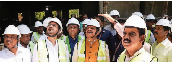
निर्माणधीन आई टी पार्क-3 के निरीक्षण के दौरान कही। उन्होंने कहा कि इंदौर को हम मध्य प्रदेश के आईटी और सेवा क्षेत्र को विकास राजधानी के रूप में विकसित कर रहे हैं। आने वाले वर्षों में यहां विकसित होने वाला आईटी पार्कों का समग्र इकोसिस्टम प्रदेश को नई आर्थिक गति प्रदान करेगा। उन्होंने कहा कि विकसित किया जा रहे आईटी

इंदौर, 18 जून। मुख्यमंत्री डॉ. मोहन यादव ने कहा कि मध्य प्रदेश को देश का अग्रणी आईटी और सेवा क्षेत्र का केंद्र बनाने का हमारा संकल्प है। उज्जैन-इंदौर मेट्रोपालिटन रीजन (यूआईएमआर) इस परिवर्तन का ग्रेय इंजन बनेगा। आईटी पार्क-3, आईटी पार्क-4 आईटी पार्क उज्जैन, इंदौर- पीथमपुर इकोनामिक कोरिडोर और निजी क्षेत्र की परियोजनाएं मिलकर एक ऐसा आधुनिक इकोसिस्टम तैयार करेंगी और मध्य प्रदेश को डिजिटल अर्थव्यवस्था की नई ऊंचाइयों तक पहुंचाएगा। मुख्यमंत्री डॉ. मोहन यादव ने यह बात गुरुवार को इंदौर में