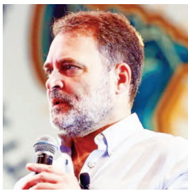
ऑनलाइन अभियान से जुड़कर छात्र साझा करेंगे सुझाव, सरकार तक पहुंचेगी आवाज

नई दिल्ली, 18 जून। लोकसभा में विपक्ष के नेता और कांग्रेस सांसद राहुल गांधी ने छात्रों और युवाओं से जुड़े मुद्दों को लेकर गुरुवार को 'छात्रों की गूंज' नाम से नया अभियान शुरू किया। सोशल मीडिया प्लेटफॉर्म 'एक्स' पर इसकी जानकारी देते हुए उन्होंने देशभर के छात्रों से इस पहल का हिस्सा बनने और शिक्षा व रोजगार से जुड़े अपने सुझाव साझा करने की अपील की। राहुल गांधी ने कहा कि यह अभियान उन लाखों छात्रों की आवाज बनने का प्रयास है, जिन्होंने पेपर लीक, परीक्षाओं में धांधली, बढ़ती फीस और रोजगार जैसी समस्याओं का सामना किया है। उन्होंने कहा कि कई परिवार अपने बच्चों की पढ़ाई के लिए जीवनभर की जमा-पूजी खर्च कर देते हैं, लेकिन व्यवस्था की खामियों के कारण छात्रों के सपने अधूरे रह जाते हैं। उन्होंने बताया कि 'छात्रों की गूंज' केवल एक अभियान नहीं, बल्कि छात्रों की मांगों को सरकार तक पहुंचाने का माध्यम है। इसके