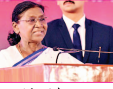
महत्वपूर्ण हो गयी है। इसी के बल पर दीर्घकालिक रूप से समता परक आचरण पद्धति और प्राकृतिक संपदाओं के प्रति संवेदनशील जीवन शैली विकसित की जा सकती है। राष्ट्रपति मुर्मू ने कहा कि समाज का वास्तविक सशक्तिकरण तब होता है जब व्यक्ति आत्मविश्वास, आत्मसम्मान और जागरूकता के बल पर सामाजिक दायित्वबोध के साथ अपने कार्यक्षेत्र में सक्रिय होता है।

बैतूल, 18 जून। राष्ट्रपति द्रौपदी मुर्मू ने कहा कि विकास और संस्कृति, दोनों का संतुलन ही एक सशक्त एवं समृद्ध समाज का आधार है। सार्थक विकास वह है जो हमारी जड़ों और जीवन मूल्यों से प्यार भी ग्रहण करे तथा उच्च जड़ों को मजबूत भी बनाए। राष्ट्रपति द्रौपदी मुर्मू गुरुवार को मध्य प्रदेश के बैतूल में प्रजापिता ब्रह्माकुमारी ईश्वरयी विश्वविद्यालय द्वारा आयोजित 'आध्यात्मिक जागृति से जनजातीय समाज का सशक्तिकरण' महासम्मेलन को संबोधित कर रही थीं। उन्होंने कहा कि उपभोग की संस्कृति पर आधारित आज की तेज भागती दुनिया में समाज के हर वर्ग की आध्यात्मिक शुचिता बहुत