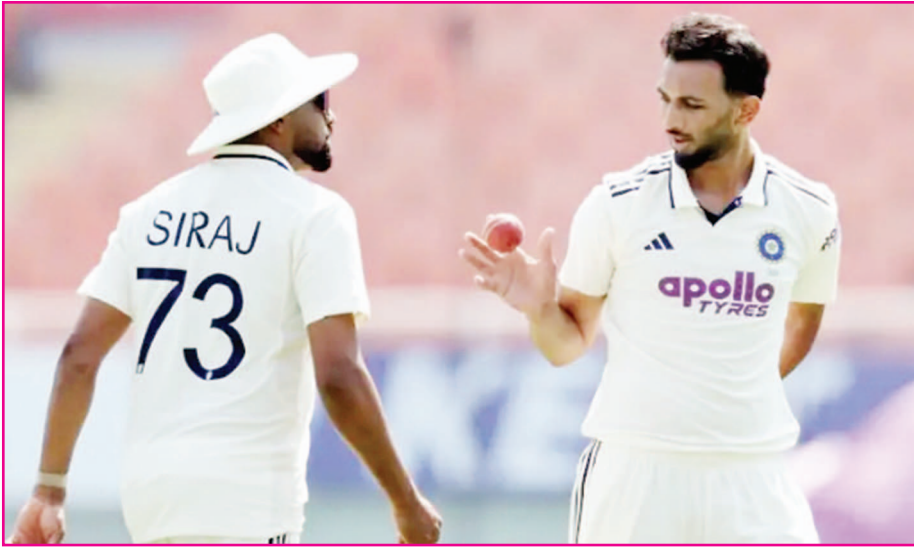
लगातार मौके दिए जा रहे हैं। वह अफगानिस्तान के खिलाफ 13 जून से शुरू होने वाली तीन मैचों की एकदिवसीय श्रृंखला के लिए भी भारतीय टीम का हिस्सा है। प्रसिद्ध अब तक भारत के लिए पांच टी-20

नई दिल्ली। भारतीय तेज गेंदबाज मोहम्मद सिराज को आयरलैंड और इंग्लैंड के खिलाफ आगामी टी-20 अंतरराष्ट्रीय श्रृंखला से बाहर कर दिया गया है। उनकी जगह गुजरात टाइटंस के साथी तेज गेंदबाज प्रसिद्ध कृष्णा को भारतीय टीम में शामिल किया गया है। भारतीय क्रिकेट कंट्रोल बोर्ड (बीसीसीआई) ने मंगलवार को बताया कि मेडिकल टीम और टीम प्रबंधन के साथ चर्चा के बाद सिराज को आराम देने का फैसला लिया गया है। यह निर्णय एहतियाती कदम के तौर पर लिया गया है, ताकि लंबे अंतरराष्ट्रीय सत्र से पहले उन्हें पर्याप्त समय तक रिकवरी मिल सके। सिराज हाल ही में न्यू चंडीगढ़ में अफगानिस्तान के खिलाफ भारत की टेस्ट जीत का हिस्सा रहे थे। हालांकि, उन्हें अफगानिस्तान के खिलाफ एकदिवसीय श्रृंखला के लिए पहले ही टीम में जगह नहीं दी गई थी। दूसरी ओर, प्रसिद्ध कृष्णा को