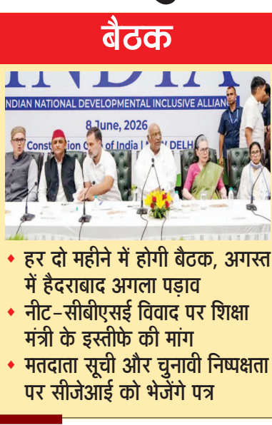
लोकतांत्रिक मूल्यों और संवैधानिक संस्थाओं की

नई दिल्ली 08 जून। आगामी राजनीतिक चुनौतियों तथा संसद से लेकर सड़क तक विपक्ष की साझा रणनीति तैयार करने के उद्देश्य से सोमवार को दिल्ली के कांस्टीट्यूशन क्लब में इंडिया गठबंधन की सातवां बैठक आयोजित हुई। बैठक में 25 विपक्षी दलों के नेताओं ने हिस्सा लिया। कांग्रेस अध्यक्ष मल्लिकार्जुन खरगे, सोनिया गांधी, राहुल गांधी, तृणमूल कांग्रेस प्रमुख ममता बनर्जी, समाजवादी पार्टी अध्यक्ष अखिलेश यादव, राष्ट्रवादी कांग्रेस पार्टी (एसपी) की सुषिमा सुले, राजद नेता तेजस्वी यादव, उमर अब्दुल्ला, महबूबा मुफ्ती, कपिल सिब्बल समेत कई वरिष्ठ नेता मौजूद रहे, जबकि शिवसेना (यूबीटी) प्रमुख उद्धव ठाकरे और झारखंड के मुख्यमंत्री हेमंत सोरेन वर्चुअल माध्यम से बैठक में शामिल हुए। दो घंटे से अधिक समय तक चली बैठक के बाद कांग्रेस अध्यक्ष मल्लिकार्जुन खरगे ने बताया कि गठबंधन पांच प्रमुख मुद्दों पर सहमत हुआ है और इन विषयों पर संयुक्त रूप से संघर्ष करेगा। उन्होंने कहा कि इंडिया गठबंधन का गठन