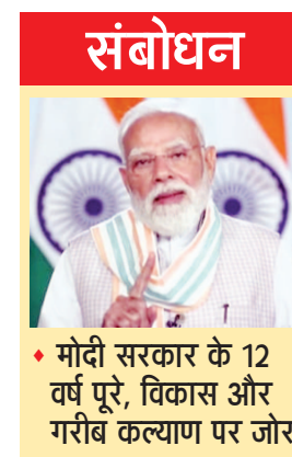
संबोधन • मोदी सरकार के 12 वर्ष पूरे, विकास और गरीब कल्याण पर जोर

नई दिल्ली, 08 जून। प्रधानमंत्री नरेंद्र मोदी ने केंद्र में अपनी सरकार के 12 वर्ष पूरे होने के अवसर पर देश की विकास यात्रा और जनकल्याणकारी उपलब्धियों को रेखांकित किया। उन्होंने कहा कि इस पूरे कार्यकाल में सरकार का मुख्य उद्देश्य समाज के अंतिम पायदान पर खड़े व्यक्ति तक विकास का लाभ पहुंचाना रहा है और इसी सोच के नीति निर्माण की दिशा तय की है। प्रधानमंत्री ने सोशल मीडिया मंच 'एक्स' पर साझा संदेशों में कहा कि उनकी सरकार 'अंत्योदय' के सिद्धांत से प्रेरित रही है, जिसके तहत लंबे समय से