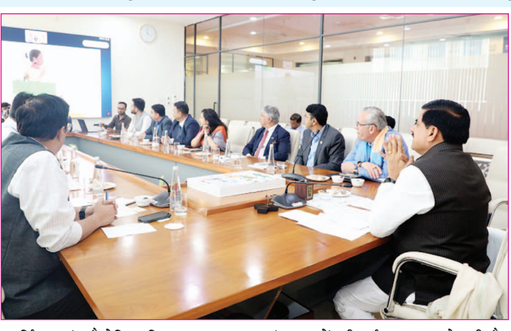
आर्थिक एवं औद्योगिक विकास का नया अध्याय लिख रहा है। हेलियन कंपनी ने भारत में पहली मैनुफेक्चरिंग यूनिट के लिए मध्य प्रदेश के पीथमपुर को चुना है। मध्य प्रदेश की भूमि सफलता की धरती भी है। मध्य प्रदेश सरकार और हेलियन कंपनी के बीच आज परस्पर विश्वास की और असीम

भोपाल, 08 जून। मध्य प्रदेश के मुख्यमंत्री डॉ. मोहन यादव ने कहा कि प्रधानमंत्री नरेंद्र मोदी के नेतृत्व में भारत आज पूरी दुनिया में 'फामेसी ऑफ द वर्ल्ड' के रूप में अपनी सशक्त पहचान बना चुका है। वर्तमान में दुनिया भारत को केवल एक बड़े बाजार के रूप में ही नहीं, बल्कि एक भरोसेमंद उत्पादन केंद्र, वैश्विक सप्लाई चैन पार्टनर और आर्थिक महाशक्ति के रूप में भी देख रही है। भारत को 'ग्लोबल फार्मा हब' बनाने में मध्य प्रदेश की भूमिका तेजी से बढ़ रही है। मुख्यमंत्री डॉ. यादव सोमवार को पीथमपुर में स्थापित होने जा रही विश्व की अग्रणी कंज्युमर हेल्थकेयर कंपनी हेलियन ग्रुप की देश में पहली मैनुफेक्चरिंग यूनिट के भूमि-पूजन समारोह (वर्चुअल ग्राउंडब्रेकिंग सेरेमनी) को वीडियो कॉन्फ्रेंसिंग से संबोधित कर रहे थे। उन्होंने रिमोट का बटन दबाकर कंपनी की नई मैनुफेक्चरिंग यूनिट का सकारितक भूमि-पूजन किया। मुख्यमंत्री ने कहा कि मध्य प्रदेश आज हर क्षेत्र में निवेश के नये युग में प्रवेश कर