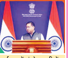
• ईरान में फंसे भारतीयों से जल्द देश छोड़ने की अपील • बढ़ते सैन्य संघर्ष के बीच यात्रा टालने की सलाह

नई दिल्ली, 08 जून। ईरान और इजरायल के बीच फिर बढ़ते सैन्य संघर्ष के बीच भारत सरकार ने अपने नागरिकों के लिए नई एडवाइजरी जारी की है। ईरान में भारतीय दूतावास ने सभी भारतीयों को फिलहाल ईरान की यात्रा से बचने की सलाह दी है। साथ ही वहां मौजूद भारतीय नागरिकों से उपलब्ध परिवहन साधनों का उपयोग कर जल्द से जल्द देश छोड़ने को कहा गया है। दूतावास ने सोशल मीडिया मंच एक्स पर जारी संदेश में कहा कि क्षेत्र में तेजी से बदलते सुरक्षा हालात को देखते हुए पहले जारी परामर्श को दोहराया जा रहा है।