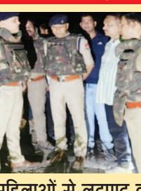
महिलाओं से लूटपाट की कई घटनाओं में पुलिस को थी दोनों की तलाश

जेवरात लूटे थे, जिसके बाद पुलिस लगातार उनकी तलाश में जुटी हुई थी।