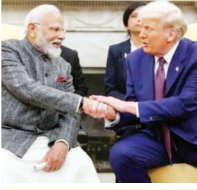
दिल्ली समारोह में ट्रंप का लाइव कॉल, मोदी की खुलकर तारीफ

नई दिल्ली, 25 मई। भारत और अमेरिका के रिश्तों को लेकर अमेरिकी राष्ट्रपति डोनाल्ड ट्रंप ने एक बार फिर प्रधानमंत्री नरेंद्र की खुलकर प्रशंसा की है। नई दिल्ली में आयोजित अमेरिकी दूतावास के 'राष्ट्रीय दिवस स्वागत समारोह' के दौरान राष्ट्रपति ट्रंप का अचानक लाइव फोन कॉल आने से पूरा कार्यक्रम चर्चा का विषय बन गया। समारोह में मौजूद लोगों ने ट्रंप की आवाज सुनते ही तालियों से उनका स्वागत किया।