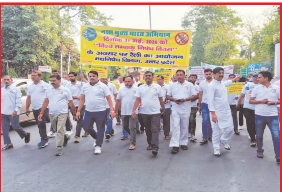
मद्य निषेध विभाग ने अशोक मार्ग से महात्मा गांधी की प्रतिमा तक विश्व तम्बाकू निषेध दिवस पर निकाली जागरूकता रैली।

शेड गिरने की घटना के बाद रेलवे ने यह कदम उठाया है। जानकारी के तहत गत 31 मई और 1 जून को चारबाग रेलवे स्टेशन के प्लेटफॉर्म नंबर 2 और 5 पर सुबह 11:00 बजे से शाम 5:00 बजे तक कोई ट्रेन नहीं आ सकेगी। इसी दौरान प्लेटफॉर्म नंबर 4 पर 23 जून तक