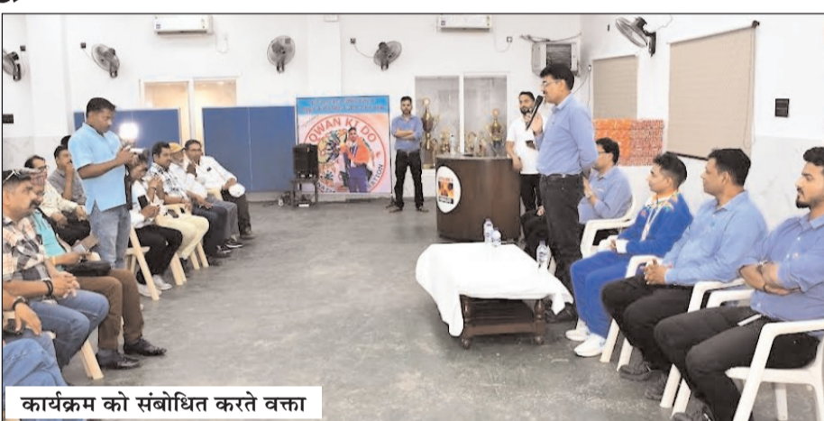
कार्यक्रम को संबोधित करते वक्ता

मूल्यों-ईमानदारी एवं गति की विस्तृत जानकारी दी गई