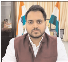
डीएम का बयान

किसानों की सुविधा के लिए ई-केवाईसी के कई विकल्प उपलब्ध कराए गए हैं, जिनके माध्यम से किसान आसानी से अपनी प्रक्रिया पूर्ण कर सकते हैं। भारत सरकार द्वारा विकसित पीएम किसान मोबाइल एप के माध्यम से किसान घर बैठे स्वयं फेसियल ई-केवाईसी कर सकते हैं। इसके अतिरिक्त किसान निकटतम जन सेवा केंद्र पर जाकर बायोमेट्रिक ई-केवाईसी भी करा सकते हैं। इसके लिए आधार कार्ड एवं आधार से लिंक मोबाइल नंबर आवश्यक होगा। कृषि विभाग के न्याय पंचायत एवं विकास खंड स्तर के कर्मचारियों के माध्यम से भी किसानों को ई-केवाईसी कराई जा रही है। प्रधानमंत्री किसान सम्मान निधि योजना के अंतर्गत पात्र किसानों को प्रतिवर्ष रूपसे 6000 को अधिक सहायता तीन समान किस्तों में सीधे उनके बैंक खातों में भेजी जाती है।