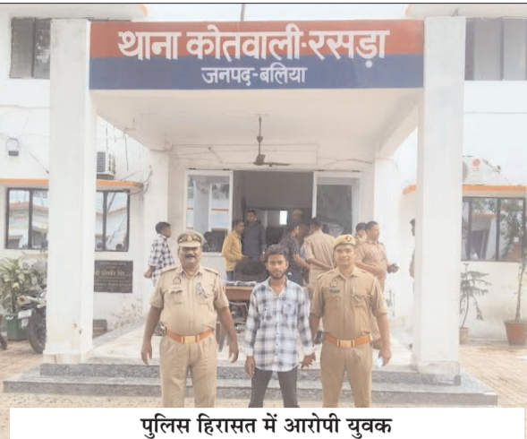
पुलिस हिरासत में आरोपी युवक