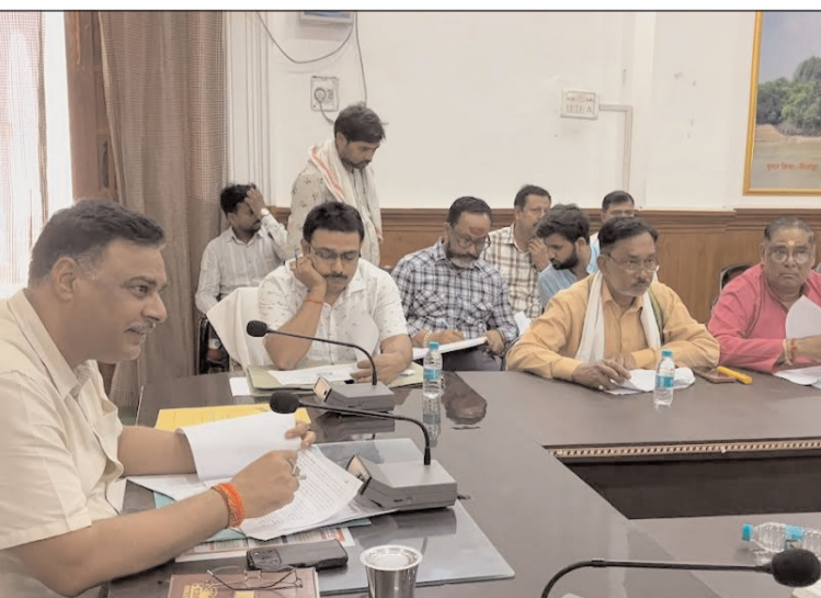
बैठक करते हुए जिलाधिकारी

जिलाधिकारी ने निवेश मित्र पोर्टल की समीक्षा करते हुए पाया कि 69 प्रकरण विभिन्न विभागों में लंबित हैं। इसी प्रकार सीएम युवा उद्यमी विकास अभियान योजना 2025-26 के अंतर्गत बैंकों को भेजे गए 973 आवेदन पत्र आनलाइन अग्रसारित किए गए जिसमें 136 स्वीकृत, 108 आवेदन पत्र विवरित तथा 314 आवेदन पत्र विभिन्न बैंकों द्वारा निरस्त किए गए जबकि 620 आवेदन पत्र बैंकों में स्वीकृति हेतु लम्बित है। जिलाधिकारी ने संबंधित अधिकारियों पर कड़ी नाराजगी व्यक्त करते हुए कहा कि ईज ऑफ ड्रुंग बिजनेस सरकार की प्राथमिकता है अतएव सभी लंबित एनओसी, आनपति और स्वीकृतियां अखिलम्ब जारी करते हुए वितरण की कार्यवाही भी सुनिश्चित की जाए। चुनाव से तीन किलोमीटर आगे स्थित लगभग 10 ईकाईयों को जोड़ने वाले चुनाव उदित नगर बड़ा गांव जर्जर मार्ग बनवाने तथा शहरी क्षेत्र में पेयजल