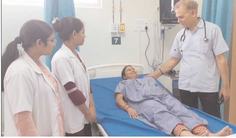
अशोक हॉस्पिटल में निःशुल्क सर्जरी कैंप में महिला सिर्फ का स्वास्थ्य परीक्षण करते चिकित्सक