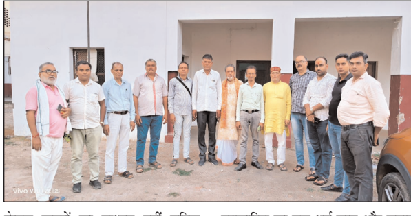
केवल खबरों का माध्यम नहीं बल्कि समाज की चेतना का प्रहरी है। उन्होंने कहा कि तकनीक बदल सकती है, लेकिन