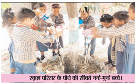
स्कूल परिसर के पौधों को सींचते नन्दे मुहंछे बच्चे।

कासिमाबाद (गाजीपुर)। प्रचंड धूप और तपती हुई गर्म हवाओं ने पशु पक्षियों समेत समस्त जीवों को बेहाल कर दिया है। पर्यावरण को शुद्ध रखने वाले पेड़ पौधों की पत्तियां भी तेज धूप में मलीन हो जा रही हैं। पर्यावरण को बचाने के लिए पौधों को बचाना अति आवश्यक है जिसके तहत पी.एच. कावेन्ट इंग्लिश स्कूल जादौशपुर के नन्दे मुहंछे छोटे बालकों ने पौधों को जल देकर पर्यावरण बचाने की दिशा में समाज को एक सकारात्मक संदेश दिया है। स्कूल के तर्फ से चलाया जा रहा पर्यावरण बचाओ अभियान में छोटे-छोटे बच्चों ने भी सक्रियता दिखाते हुए महत्वपूर्ण भूमिका निभाई। बच्चों ने सामूहिक रूप से हर एक पौधों को सींच कर अभियान को सफल बनाया। इस