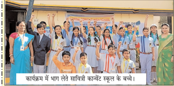
कार्यक्रम में भाग लेते सावित्री कान्वेंट स्कूल के बच्चे।