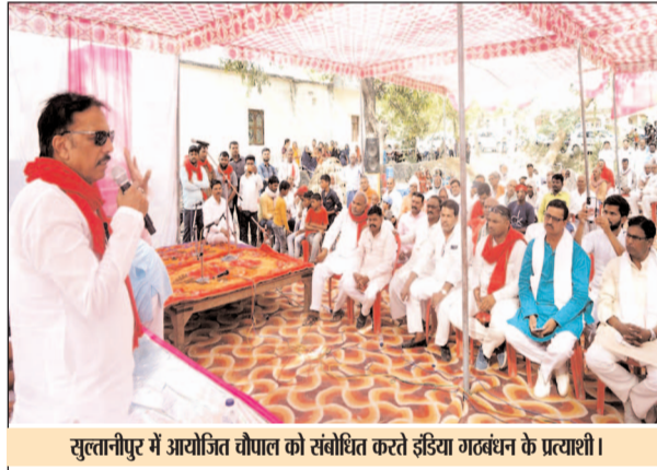
सुलतानपुर में आयोजित गोपाल को संबोधित करते इंडिया गठबंधन के प्रत्याशी।

मुहम्मदाबाद गोहना विधानसभा क्षेत्र के दर्जनभर गांवों में ग्रामीणों से मांगा आशीर्वाद वर्ष 2014 में चुनाव हार गया लेकिन मैं आप लोगों को छोड़कर नहीं गया