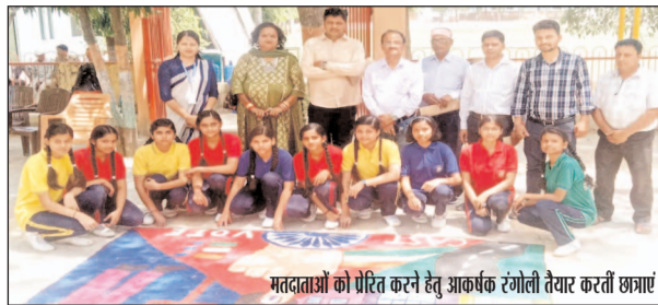
मतदाताओं को प्रेरित करने हेतु प्राथमिक रंगोली तैयार करती छात्राएं

मऊ। मुख्य विकास अधिकारी नोडल अधिकारी स्वीप के निर्देश पर मतदाता जागरूकता अभियान के तहत माध्यमिक शिक्षा विभाग द्वारा जिलास्तरीय रंगोली प्रतियोगिता का भव्य आयोजन डॉ भीम राव अंबेडकर स्पोर्ट्स स्टेडियम में किया गया। इस दौरान रंगोली के माध्यम से माध्यमिक शिक्षा के 8 प्रतिष्ठित विद्यालयों सोनीथापा खंडेलवाल बालिका इंटर कॉलेज, जौजीआईसी, रामस्वरूप भारती इंटर कॉलेज, एलएफसीएस इंटरनेशनल, एलएफसीएस, सेंट जेवियर्स कॉलेज, आलिया इंटर कॉलेज, सनबीम स्कूल ने भाग लिया और मतदाता जागरूकता का संदेश दिया। मतदाता जागरूकता के तहत