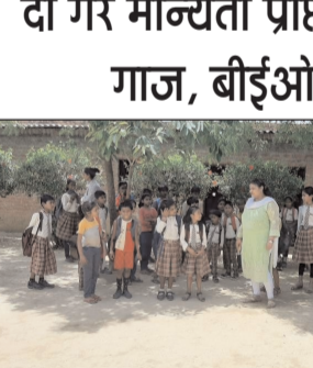
महाराजगंज। स्थानीय क्षेत्र में गैर मान्यता के चल रहे दो विद्यालयों में खण्ड शिक्षा अधिकारी ने मौके पर पहुंच कर चेतावनी देकर तालाबंदी कराया। सराय पट्टरी में गैर मान्यता प्राप्त कक्षा एक से पांच तक संचालित एसएस पब्लिक स्कूल के प्रबंधक

दो गैर मान्यता प्राप्त विद्यालयों पर गिरी गाज, बीईओ ने जड़ा ताला