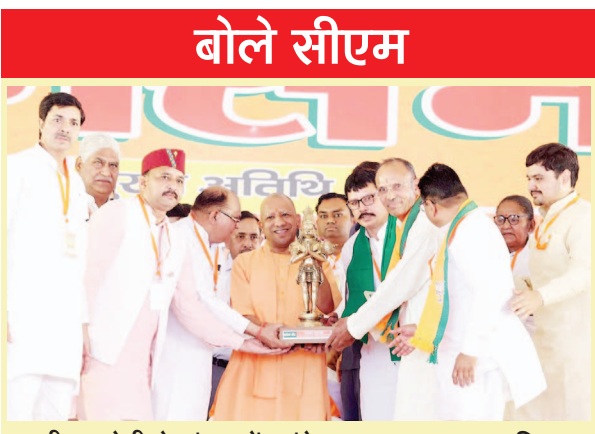
सीएम योगी ने संभल में कांग्रेस पर जमकर साधा निशाना

कहा कि उन 'विषधरो' को वोट कटई नहीं जाना चाहिए, जो भारत माता की जय-जयकार और 'वंदे मातरम' का गायन करने में संकोच करते हैं। ■ शेष पेज 13 पर