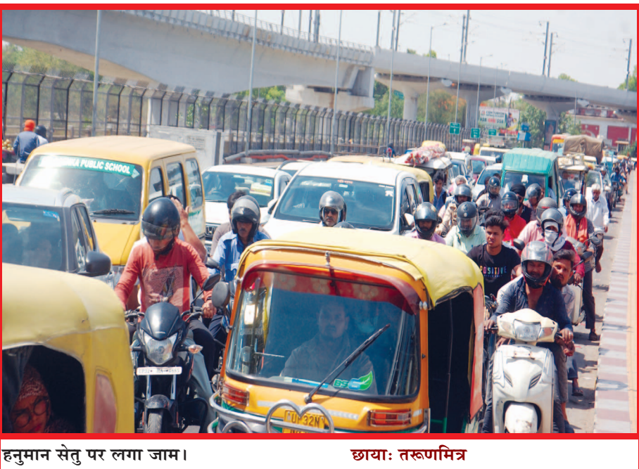
हनुमान सेतु पर लगा जाम।