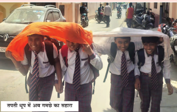
तपती धूप में अब गमछे का सहारा