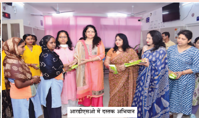
आरडीएसओ में दस्तक अभियान