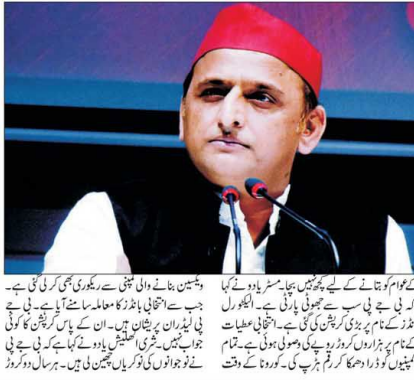
لکھنؤ: (ایف ایف ایس) سابق وزیر اعلیٰ اکھلیش یادو نے جہارکھنڈ میں مہاریلی سے کیا خطاب، جس میں انہوں نے بی جے پی کو ہر قیمت پر ہٹانا ہوگا اور ان کی حکومت کو تختہ الٹ دینا چاہیے۔ یادو نے کہا کہ ان کی حکومت نے لوگوں کو بے روزگار کر دیا ہے اور ان کی پالیسیاں لوگوں کے مفادات کے خلاف ہیں۔ یادو نے کہا کہ ان کی حکومت نے لوگوں کو بے روزگار کر دیا ہے اور ان کی پالیسیاں لوگوں کے مفادات کے خلاف ہیں۔

لکھنؤ: (پٹی) سابق وزیر اعلیٰ اکھلیش یادو نے جہارکھنڈ میں مہاریلی سے کیا خطاب، جس میں انہوں نے بی جے پی کو ہر قیمت پر ہٹانا ہوگا اور ان کی حکومت کو تختہ الٹ دینا چاہیے۔ یادو نے کہا کہ ان کی حکومت نے لوگوں کو بے روزگار کر دیا ہے اور ان کی پالیسیاں لوگوں کے مفادات کے خلاف ہیں۔ یادو نے کہا کہ ان کی حکومت نے لوگوں کو بے روزگار کر دیا ہے اور ان کی پالیسیاں لوگوں کے مفادات کے خلاف ہیں۔ یادو نے کہا کہ ان کی حکومت نے لوگوں کو بے روزگار کر دیا ہے اور ان کی پالیسیاں لوگوں کے مفادات کے خلاف ہیں۔