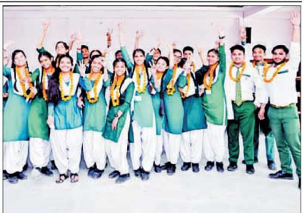
بھرتیوں والے طلباء کو سکولوں میں استقبال کیا گیا۔ ریاست میں چھٹے نمبر پر آئے۔ طلباء کو اعزاز کے ساتھ چارہائے جگہ سے نوازا گیا۔